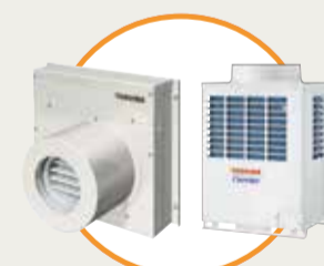
スポット・ゾーン空調システム「FLEXAIR (単体設置型)」