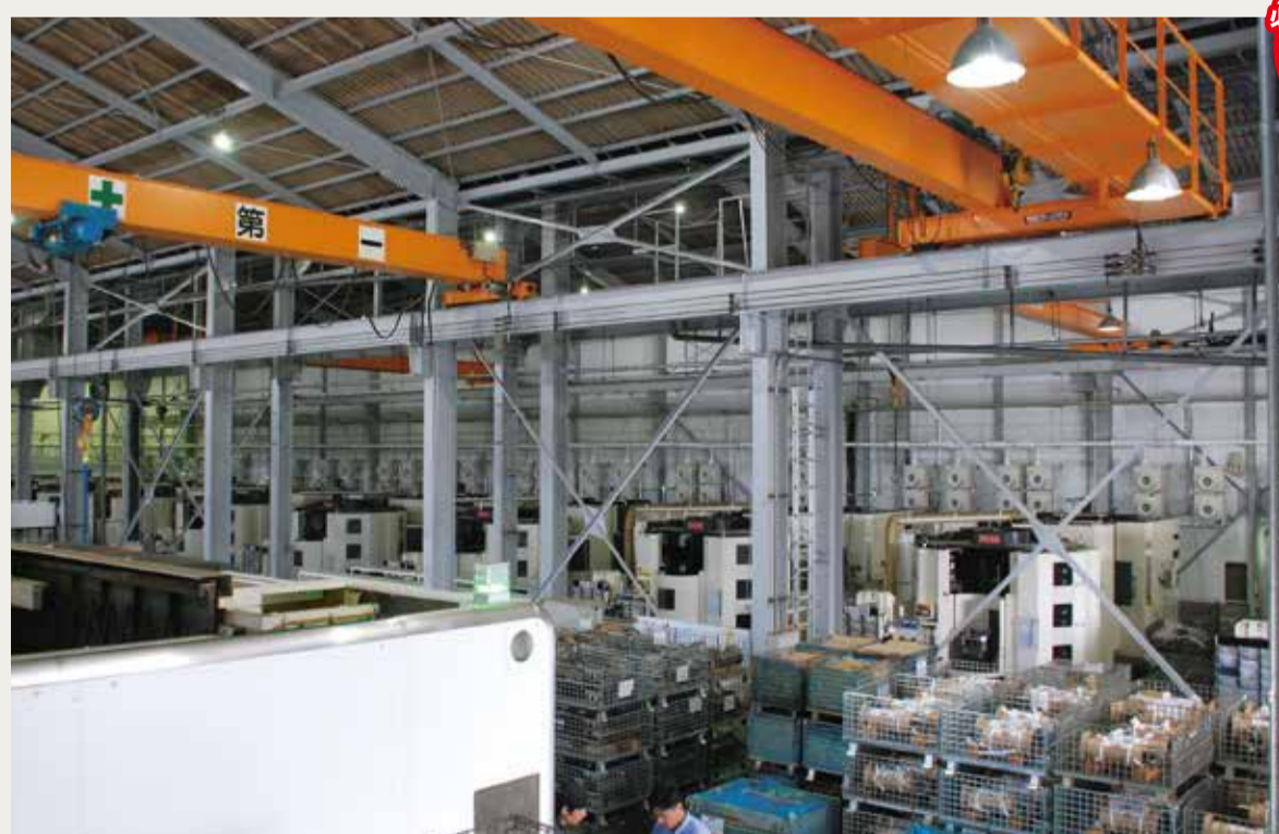
スポット・ゾーン空調システム「FLEXAIR」