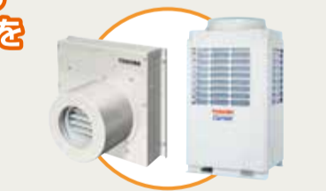
スポット・ゾーン空調システム「FLEXAIR (単体設置型)」