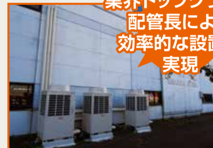
スポット・ゾーン空調システム「FLEXAIR」 室外機