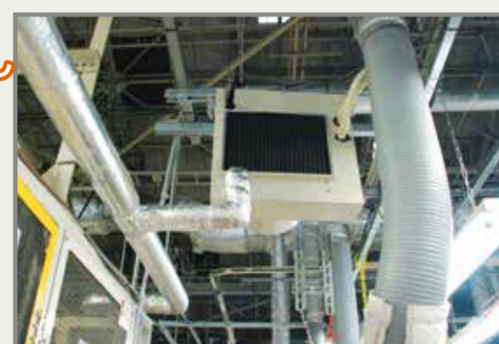
単体設置によるフレキシブルな配置