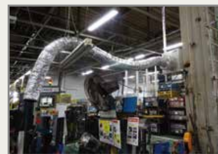
フレキシブルな設置が可能