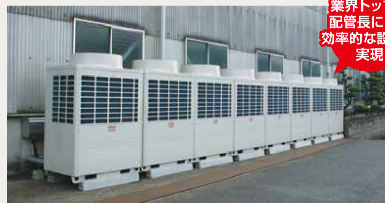
スポット・ゾーン空調システム「FLEXAIR」 室外機