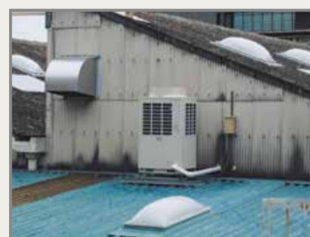
スポット・ゾーン空調システム「FLEXAIR」室外機