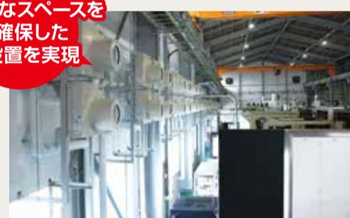
必要な場所に高さなどを計算し効率的に設置