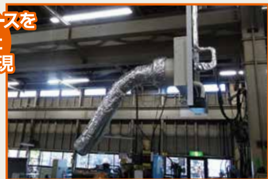
必要なエリアを狙って効率的に設置