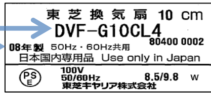
ダクト用換気扇の銘板