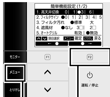
画面2：簡単機能設定